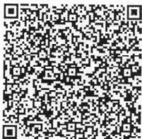
郭小军年检二维码

本证书经检验合格, 继续有效一年。 This certificate is valid for another year after this renewal.