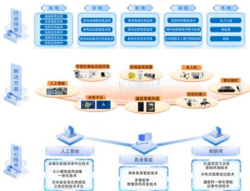
图 1 AIoT 技术体系支撑行业数智化

历经多年研发沉淀，公司从人工智能、物联网及具身智能方面，构建了工业智慧物联网（AIoT）的技术体系，打造了系列核心技术，并与行业数智化深度融合，为行业客户提供从数据采集、智能研判到自主决策的综合解决方案。未来，公司将持续深化 AIoT 技术体系研发与落地应用，以更扎实的技术积累与产品创新，助力行业数智化转型迈向纵深。