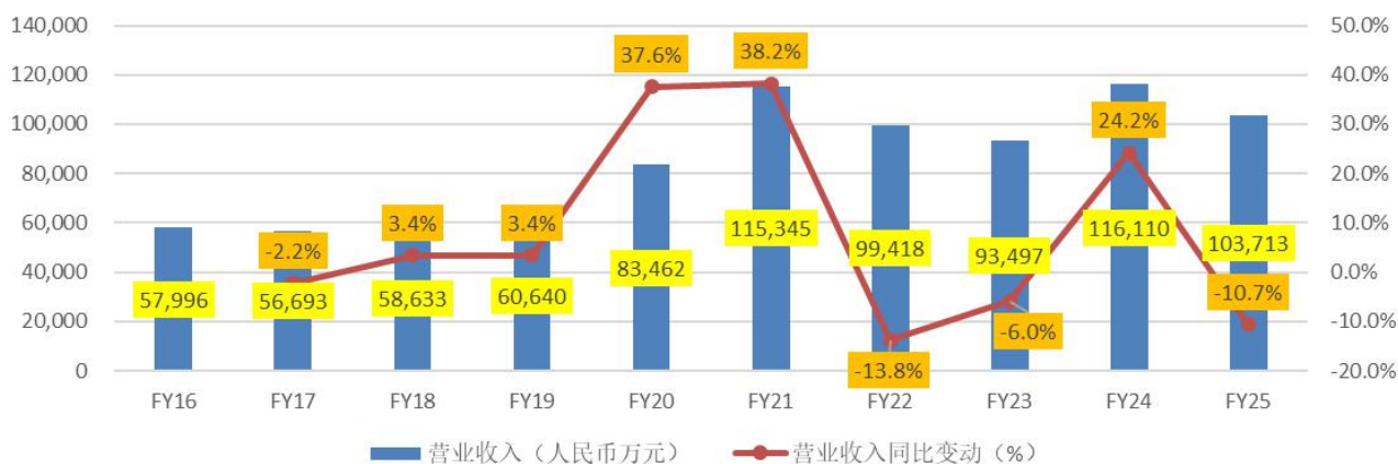
2016-2025 康平科技 营业收入及其变动

2025 年，受销售额降低等因素的影响，公司归母净利润降低至人民币 4,783.98 万元，降低比例为 43.77%。近 10 年公司的归母净利润及其变动情况如下图所示：