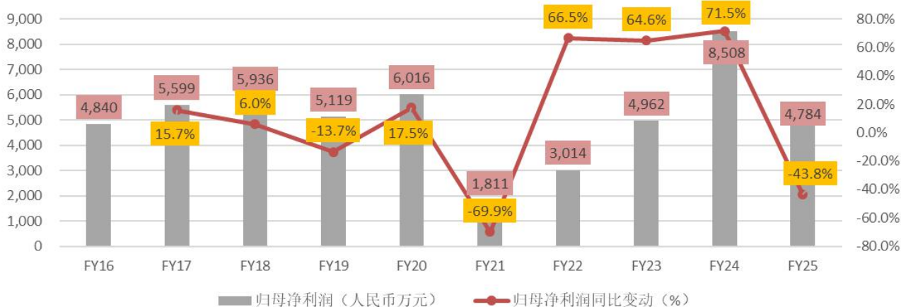
2016-2025 康平科技 归母净利润及其变动

报告期内，公司立足于相对成熟的整机研产销能力，成功开拓 LIDL 等整机客户，进一步壮大整机销售基本盘。