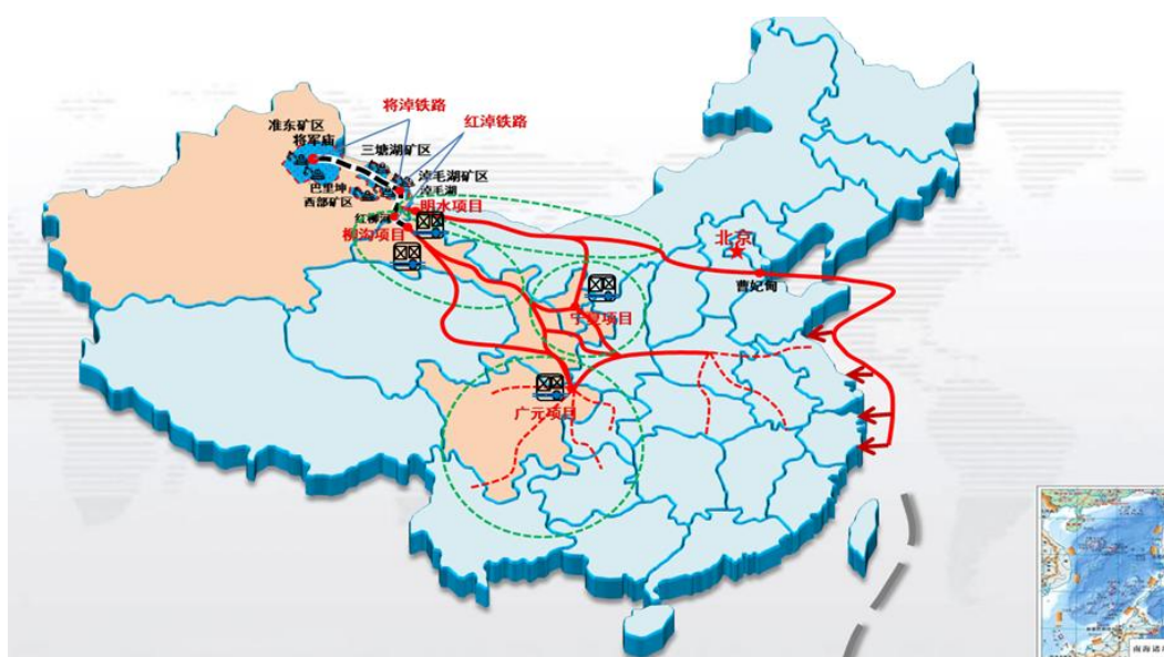
(1) 柳沟综合能源物流基地

公司在下游积极利用综合能源物流基地实现业务延伸。一是通过在资源紧缺地区布局综合能源物流基地，从而将新疆优势能源产品尤其是煤炭产品进行库存前移，将其作为煤炭产品销售的前置仓；二是通过淡储旺用进行煤炭战略储备，调节季节差异带来的市场需求；三是通过“点对点”运输，提高铁路运输效率，提升“疆煤外运”运量，增强疆煤在终端市场的竞争力；四是将运营的综合能源物流基地编织成网，充分发挥基地的节点辐射效应，相互之间形成物流支撑，提高能源物流的响应效率，扩大终端市场份额，夯实主业发展基础，增厚能源物流主业收益。