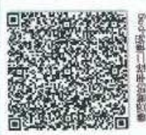
年度检验证书二维码.png

本证书经检验合格，继续有效一年。 This certificate is valid for another year after this renewal.