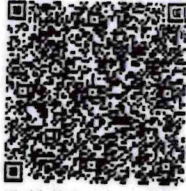
张旭的年检二维码

本证书经检验合格，继续有效一年。 This certificate is valid for another year after this renewal.