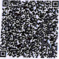
朱晓东年检二维码

本证书经检验合格，继续有效一年。 This certificate is valid for another year after this renewal.