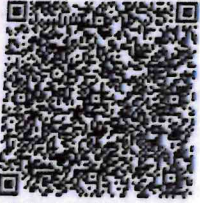
朱晓东年检二维码

本证书经检验合格，继续有效一年。 This certificate is valid for another year after this renewal.