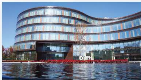
“双层呼吸式”玻璃幕墙

绿色建筑设计: 公司园区建筑采用全国领先的外循环“双层呼吸式”玻璃幕墙设计。该设计利用“烟囱效应”与“温室效应”原理,有效降低夏季制冷压力,减少冬季热损耗。经测算,一个供暖季每1万平方米可节约标准煤114.6吨,碳排放量减少约50%。