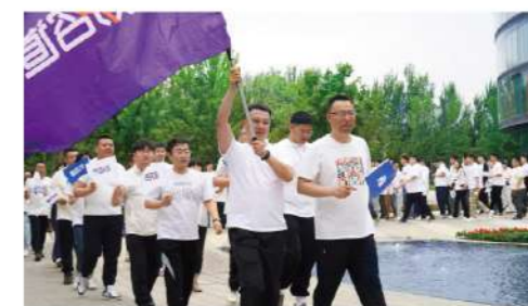
组织环保主题活动