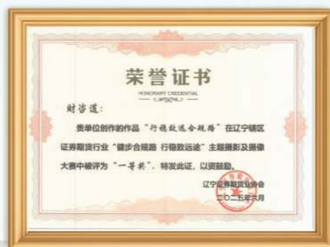
行稳致远合规路一等奖