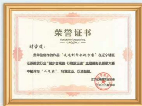
足迹刻印合规方圆人气奖