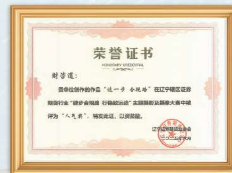
这一步 合规路人气奖