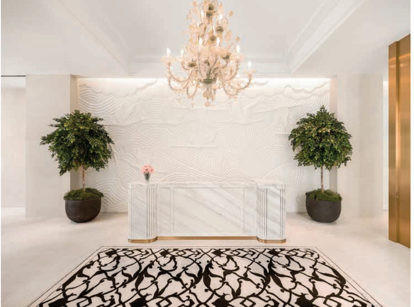
Lanson Place Hong Kong (Cover & Above) 封面及本頁圖片均攝於香港逸蘭酒店