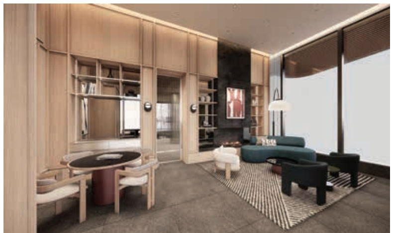
UNI Residence (Shatin, Hong Kong 香港沙田) *Artist impression 模擬效果圖