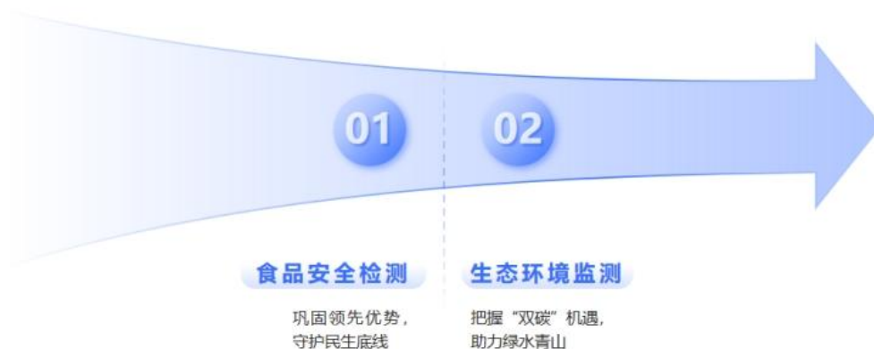
图1 持续深耕传统优势业务