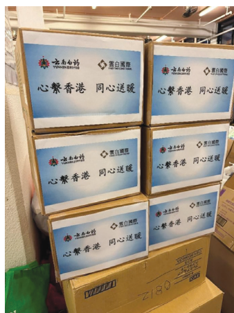
為宏福苑受影響居民捐贈物資

本年度，本集團向大埔宏福苑受火災影響的居民及家庭捐贈牙膏等日用物資，以實際行動支援社區緊急需要。我們深信企業應於社會困難時刻承擔責任，透過物資捐助及心靈關懷，為受影響家庭提供切實幫助，傳遞溫暖與支持。未來，我們將持續關注社區需要，積極參與公益事務，踐行企業公民義務，共建共融、互助的社會環境。