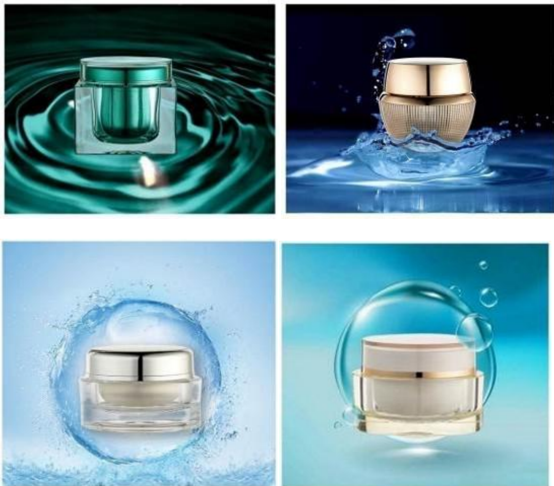
膏霜瓶系列产品示意图

膏霜瓶系列产品具有广口特性，使用时通过打开瓶盖将其中的化妆品取出使用，膏霜瓶具有结构简单且灌装方便等特点，对于粘度相对较大的化妆品是很好的包装容器选择。