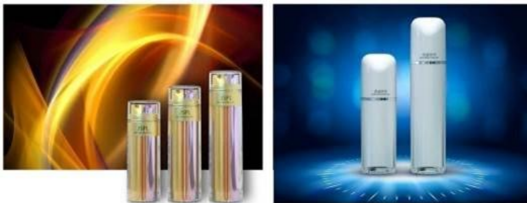
乳液瓶系列产品示意图