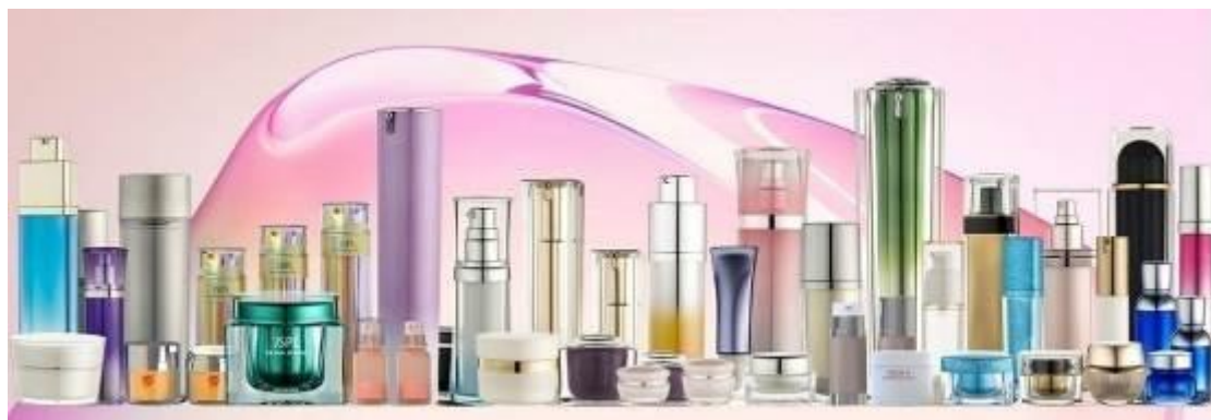
公司主要产品示意图