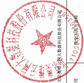
2025年度非经营性资金占用及其他关联资金往来情况汇总表