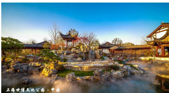
上海世博文化公园 - 中国