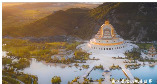
浙江省乾山景观效果图

Hangzhou Landscape Architecture Design Institute Co., Ltd.