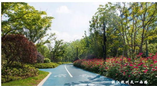
浙江杭州文一西路