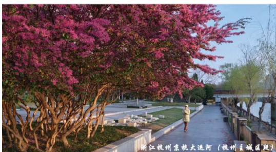
浙江杭州东坑大运河（杭州主城区段）