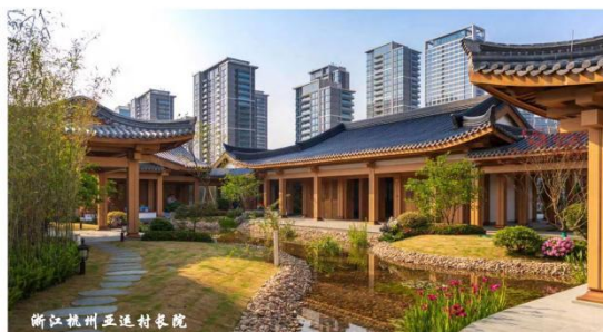
浙江杭州亚运村农院