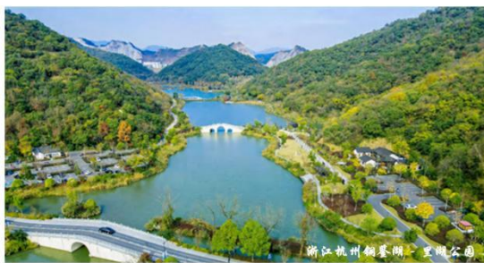
浙江杭州桐庐湖 里湖公园

Hangzhou Landscape Architecture Design Institute Co., Ltd.