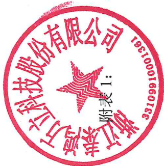
募集资金使用情况对照表