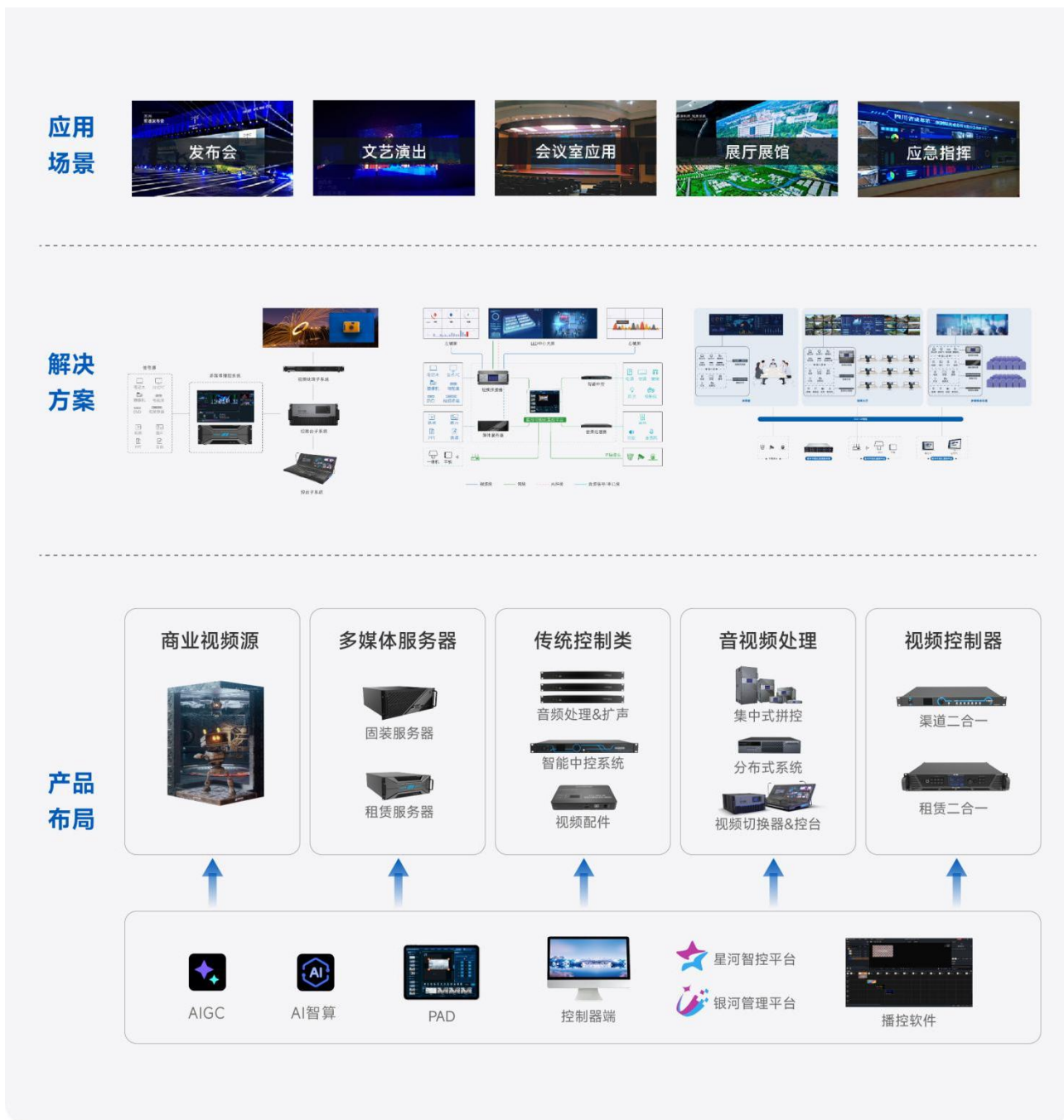
视频处理系统产品体系