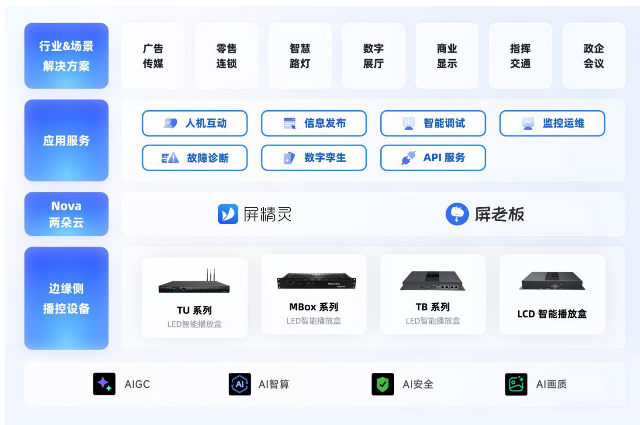
基于云的信息发布与管理系统产品体系