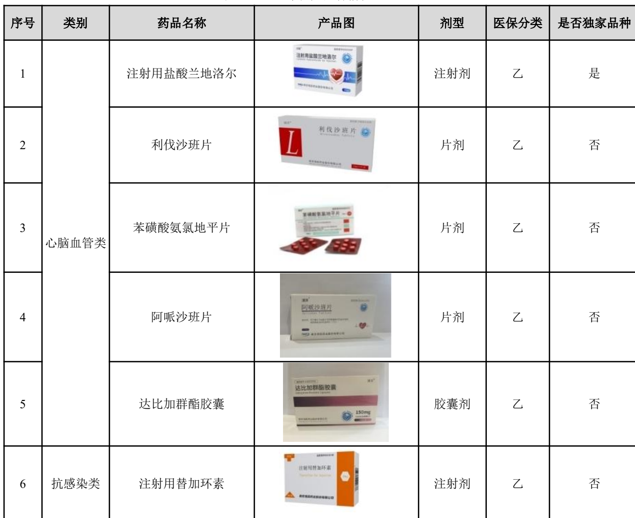
表——2025 年在产品种情况