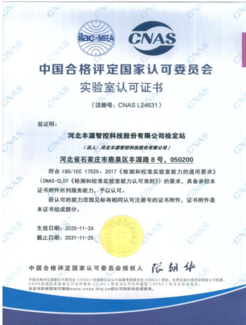
公司实验室 2025 年 11 月 26 日获得中国合格评定国家认可委员会颁发认可证书。