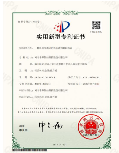
2025 年丰源智控申请实用新型专利，一种机电分离式防拆防盗物联网水表，并获得证书。