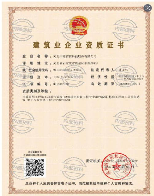
2025 年获得建筑企业资质证书二级。