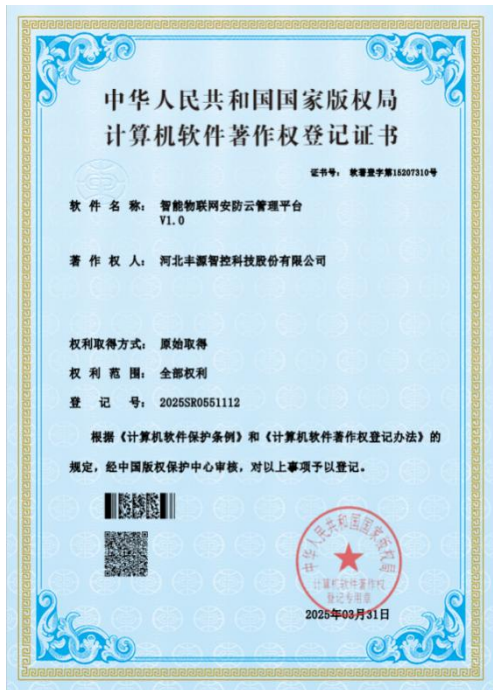
2025 年丰源智控申请软件著作权，智慧物联网安防云管理平台 V1.0，并获得证书。