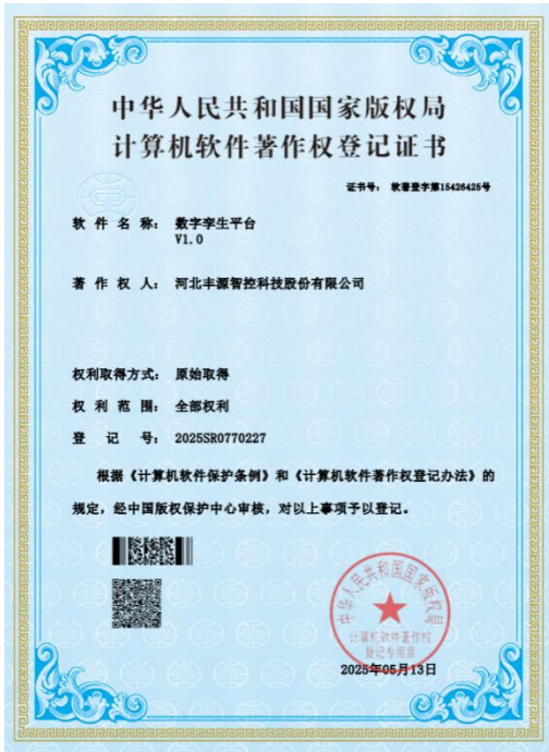
2025 年丰源智控申请软件著作权，数字孪生平台 V1.0，并获得证书。