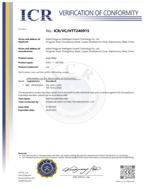
公司取得欧盟权威认证。