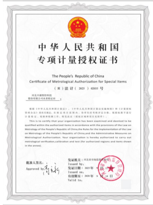
公司水表检定站 2025 年 9 月 15 日获得专项计量授权证书。