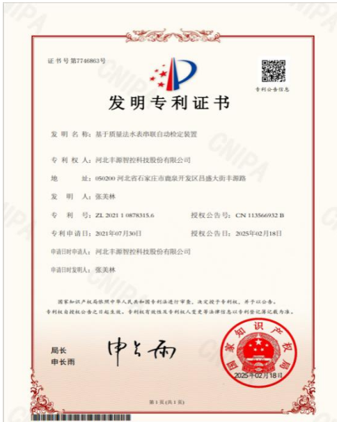
2025 年丰源智控申请发明专利，基于质量法水表串联自动检定装置，并获得证书。