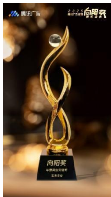
公司游戏业务板块获得的重要奖项

公司的卓越表现也赢得了行业的广泛认可，荣获多项荣誉。2025 年度，公司凭借在游戏领域的持续创新突破与亮眼实战成果，荣获“年度商业突破奖”奖项，在荣耀首届全球开发者大会暨 AI 终端生态大会，公司游戏板块获评“荣耀游戏中心-最佳小游戏伙伴奖”。公司还登上引力引擎「2025 年中国小游戏 100 强企业榜」。这些荣誉不仅是对公司过往努力与成就的高度肯定，更是激励公司在未来将继续砥砺前行，不断推出更多优质游戏作品，为全球玩家带来更多精彩娱乐体验的强大动力。