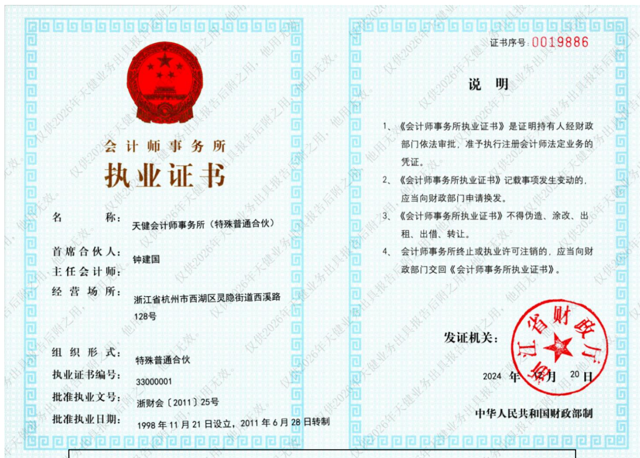
附件二 本所执业证书复印件

本复印件仅供浙江帕瓦新能源股份有限公司天健审(2026)9412号报告后附之用, 证明天健会计师事务所(特殊普通合伙)具有合法执业资质, 他用无效且不得擅自外传。