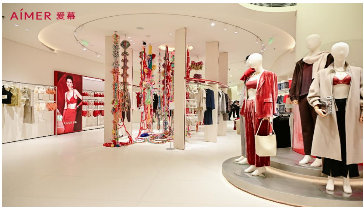
成都万象城爱慕品牌店

2025 年，爱慕开始品牌重塑，爱慕品牌店作为爱慕品牌重塑落地的全新表达，以“场景化体验+在地化设计+艺术文化加持”为核心，致力打造当地爱慕消费者新体验中心。爱慕品牌店区别于传统内衣店的单一零售属性，将填补高端内衣时装化体验空白，吸引高净值高消费客群的同时，带来更强话题性与商业溢价。