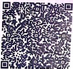
陈璐瑛年检二维码

本证书经检验合格，继续有效一年。 This certificate is valid for another year after this renewal.