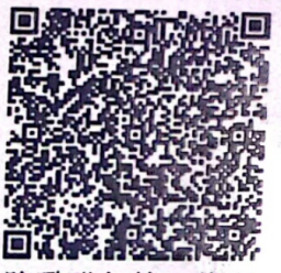
陈璐瑛年检二维码

本证书经检验合格，继续有效一年。 This certificate is valid for another year after this renewal.