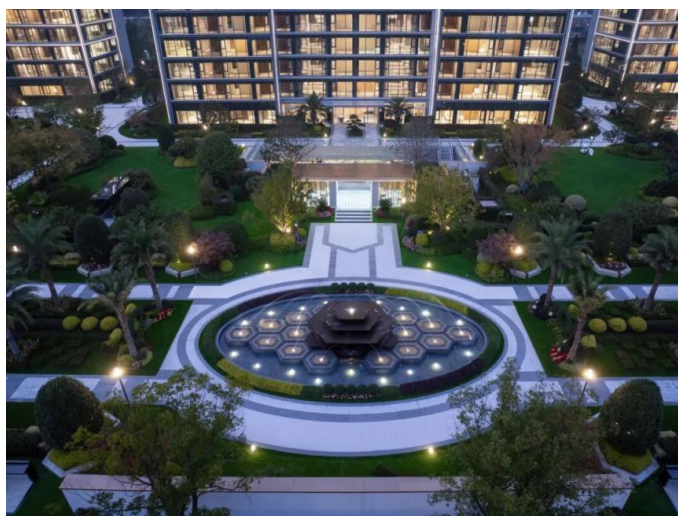
(工程项目：杭州棠前嘉座)