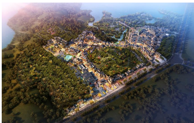
（文旅运营项目：时光贵州）

合作升级酒店设施与服务。公司通过一系列举措促进相关资产的保值增值，提升运营效益。