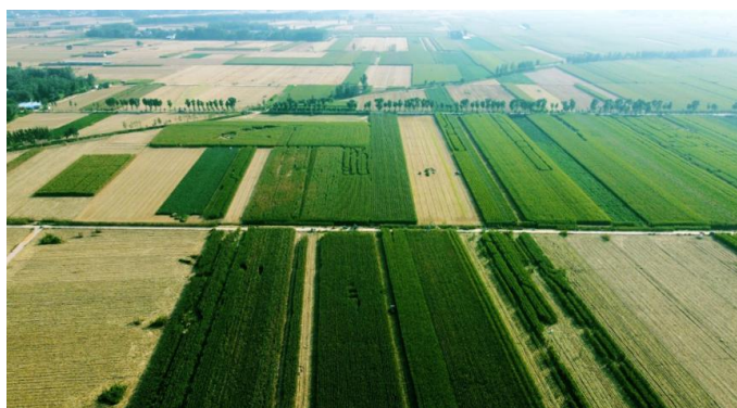
(高标准农田项目：清丰高标准农田建设项目)