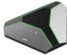
无线会议全向麦克风