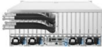
AI 算力服务器-液冷平台