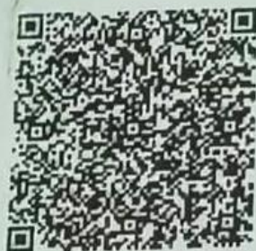
郑卫刚年检二维码

本证书经检验合格，继续有效一年。 This certificate is valid for another year after this renewal.