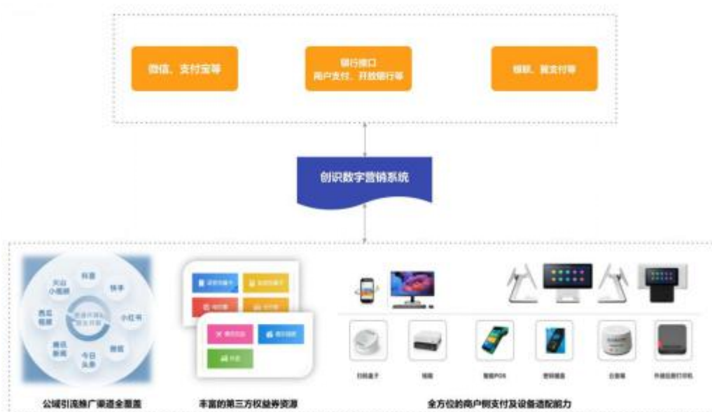
图：数字营销合作模式

公司数字营销业务以通讯行业头部运营商为依托，建立包含了互联网端各类主流获客渠道，包括信息流、直播、短视频、电商、达人、互联网媒体资源位等，结合不同媒体平台的特点，精准投放各类产品，达到预期效果，带来规模性收入和利润。依托电子支付业务积累的商户与银行资源，公司延伸布局数字营销领域，打造“跨业态、全链路”互动营销体系，定位“连接流量端与商户端的数字化营销服务商”，数字营销业务成为驱动公司业绩增长的重要新引擎。