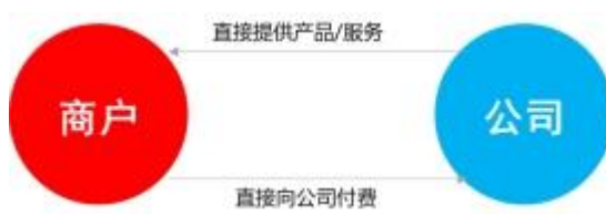
图：公司-商户的合作模式

在“公司-商户”模式下，公司产品及服务的购买对象和使用对象均为商户，该类商户多为公司直接开发的大型商户，以大型国企、事业单位和政府单位为主，客户资金实力强，倾向于直接购买支付类产品及服务。