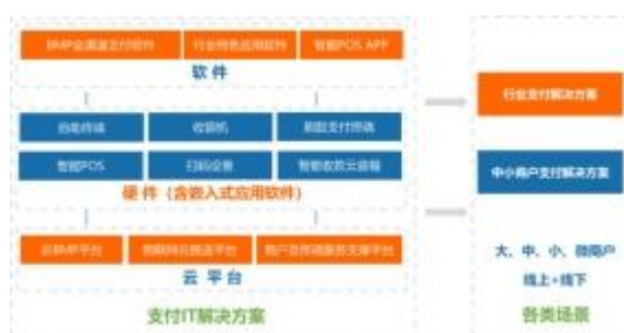
图：商户端支付解决方案

按照服务模式不同，商户规模大小，方案的个性化程度，技术实现难易程度，商户端支付解决方案分为行业支付解决方案及中小商户支付解决方案。