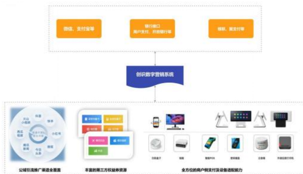
图：数字营销合作模式

公司数字营销业务以通讯行业头部运营商为依托，建立包含了互联网端各类主流获客渠道，包括信息流、直播、短视频、电商、达人、互联网媒体资源位等，结合不同媒体平台的特点，精准投放各类产品，达到预期效果，带来规模性收入和利润。依托电子支付业务积累的商户与银行资源，公司延伸布局数字营销领域，打造“跨业态、全链路”互动营销体系，定位“连接流量端与商户端的数字化营销服务商”，数字营销业务成为驱动公司业绩增长的重要新引擎。