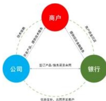
图：商户-银行-公司合作模式

一方面，商户可免费获得银行与公司提供的“金融+科技”综合服务，能够有效地帮助商户降低运营成本、提高经营效率、保证交易安全。另一方面，银行通过为商户提供电子支付相关产品及服务扩大优质商户规模、增强商户粘性，进而吸收商户在经营过程中产生的沉淀资金，充分挖掘商户需求为其提供综合金融服务、取得金融收益。同时，公司可充分利用银行的渠道快速、批量拓展商户，有助于业务的持续增长，降低了公司的业务开拓成本和财务风险。