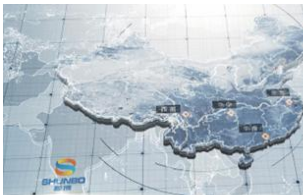
各生产基地铝合金设计产能分布

公司目前已在重庆合川、广东清远、湖北襄阳、安徽马鞍山拥有生产基地，报告期已经完成 105 万吨铸造铝合金产能建设；在变形铝合金板块，公司已拥有重庆奥博 5 万吨产能以及在建项目安徽二期 50 万吨产能。已形成了辐射西南地区、华南地区、华东地区及华中地区等再生铝主要消费市场的经营网络，区域布局多元化有利于维护本地供应商和客户关系，有效降低运输成本；有利于公司拓展全国各地的销售市场，及时抓住市场机遇，提升市场份额，提升公司的抗风险能力。