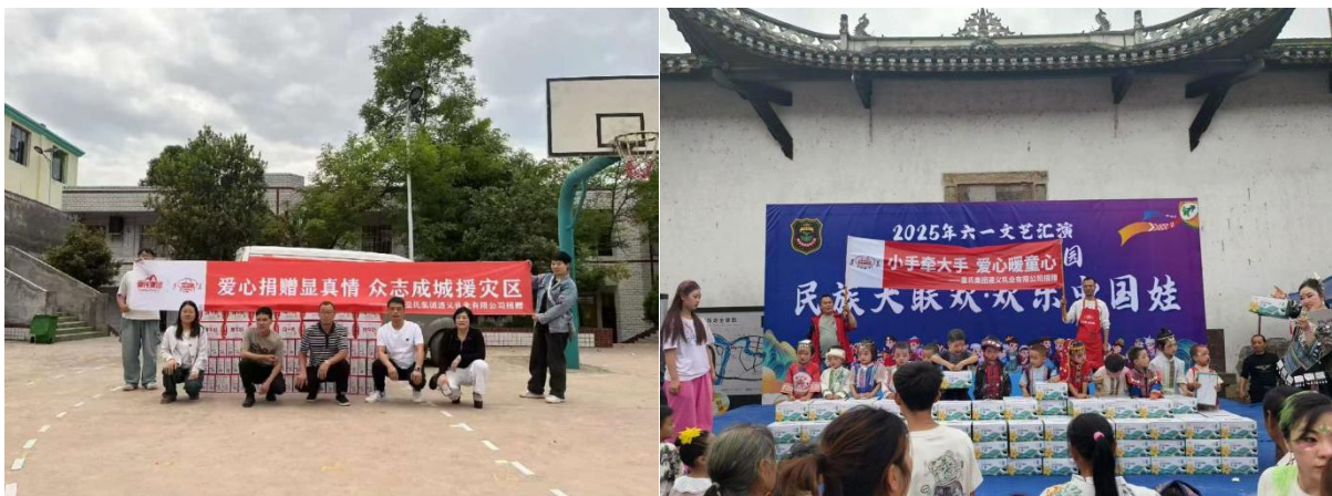
公司向灾区、留守儿童等捐赠牛奶物资

5、皇氏阳光（广西）新能源有限公司自成立以来，通过加快推进牧场光伏资源利用开发及乡镇居民屋顶户用光伏建设，助力“绿色+乡村振兴+生态”融合发展。