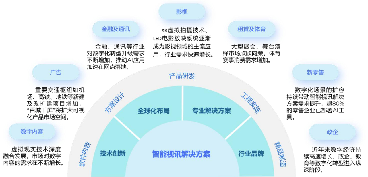
公司智能视讯业务模式及业绩驱动因素

公司采用直销为主、渠道销售为辅的销售模式，为客户提供从方案设计、产品研发、精品制造、软件及内容定制、工程实施的一体化全流程解决方案与服务。