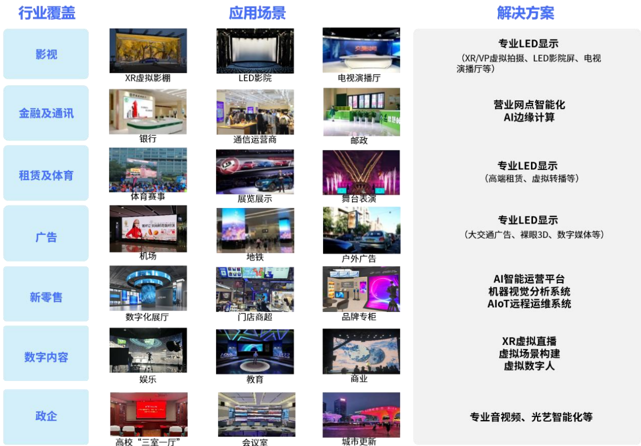
公司智能视讯业务应用领域

公司采用直销为主、渠道销售为辅的销售模式，为客户提供从方案设计、产品研发、精品制造、软件及内容定制、工程实施的一体化全流程解决方案与服务。