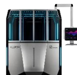
灵巧手灵巧性与运动角度智能检测设备

公司全系列人形机器人检测设备，主要面向人形机器人整机厂、零部件企业及第三方检测认证机构。该系列设备也可作为研发与教育产品提供给各类学校及科研机构，目前已获得部分订单，实现少量收入，占公司 2025 年度营业收入的比例较低，预计短期内不会对公司业绩产生重大影响。