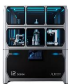
灵巧手操作力智能检测设备

人形机器人正从技术演示迈向规模化落地的关键阶段，标准体系的建设与检测验证的先行已成为产业健康发展的核心驱动力。报告期内，公司瞄准人形机器人行业标准和检测设备，联合上海人工智能研究院、无锡市锡港沪灵巧智能机器人有限公司等机构制定了《人形机器人灵巧手技术规范》等标准，推出了“灵巧手操作力动态检测”、“灵巧手灵巧性与运动角度检测”等智能检测设备并举行了首发仪式，获得央视《经济半小时》专题报道。