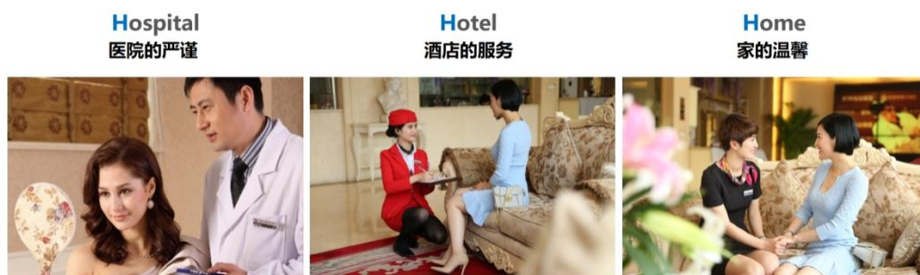
图 5 3H 服务理念

中，维多利亚设立 8 大特色科室，打造一站式高品质医美服务，累计服务数十万求美者、接诊 500 余位明星艺人，品牌影响力与市场知名度广受认可。运营层面，采用成熟标准化体系，通过 RFM 模型实现客户精准分级运营，两大医美机构累计沉淀 33 万+会员、8 万+年活跃会员，客户粘性与复购率表现优异。报告期内，两大医美机构与塑妍萃、薇旌美、艾维岚等知名品牌共同承办 30 余场新品发布会以及学术交流活动，连天美、维多利亚分别获评“第七年全球医美前沿产业大会品牌口碑影响力奖”、“2025 年度中国医美消费者信赖机构”等多项权威奖项，以专业积淀夯实口碑，构筑起独具特色的品牌与运营优势。