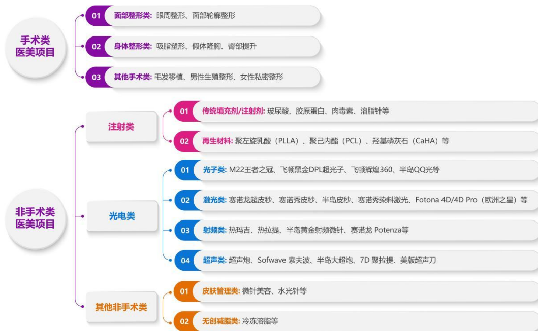
图 3 医美项目分类

根据治疗手段与创伤程度，医美可划分为手术类与非手术类两大类，其中手术类医美以面部整形、假体植入、吸脂塑形等侵入性操作为主，通常涉及麻醉与较长恢复期，代表项目包括隆鼻、隆胸及面部拉皮等；非手术类医美则以注射类、光电类及皮肤管理项目为主，具有创伤小、恢复快、可逆性强等优势，代表产品包括玻尿酸、肉毒素、激光美容仪及水光针等。