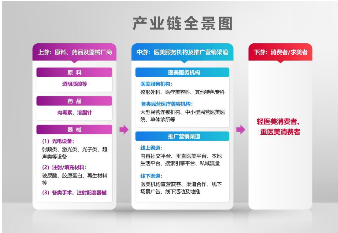
图 4 产业链全景图