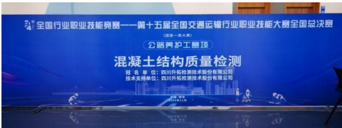
全国行业职业技能竞赛技术支持

技能人才承载产业兴盛，工匠精神助推优质智造。公司以全国行业职业技能为契机，弘扬工匠精神，引领行业发展，提升自身水平，以更精确、更安全、更可靠、更稳定、更智慧的产品与技术助力公路行业技能人才培养，为护航新时代道路交通安全运行贡献力量。