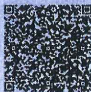
胡国仁年检二维码

本证书经检验合格，继续有效一年。 This certificate is valid for another year after this renewal.