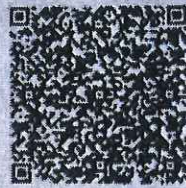
胡国仁年检二维码

本证书经检验合格，继续有效一年。 This certificate is valid for another year after this renewal.