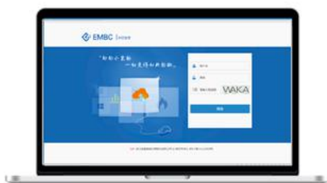
燃气云客户管理系统