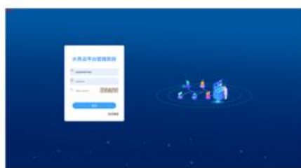
水务云客户管理系统