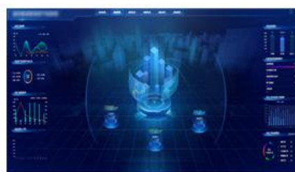
燃气云客户管理系统