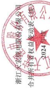
（除特别注明外，金额单位均为人民币元）