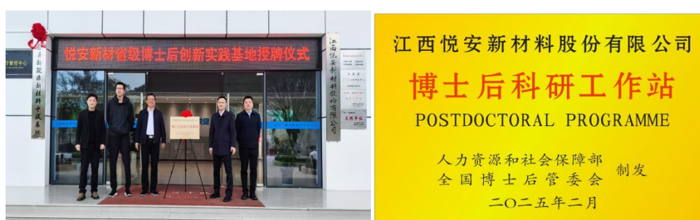
图 2：悦安新材博士后科研工作站授牌仪式

报告期内，公司正式获批设立国家级博士后科研工作站，科研创新平台迈上新台阶，为高端人才引进与核心技术攻关提供重要支撑。作为第一单位编制的团体标准《电子元器件用软磁羰基铁粉》进入意见征求阶段，公司在行业标准制定中的参与度与影响力持续提升。