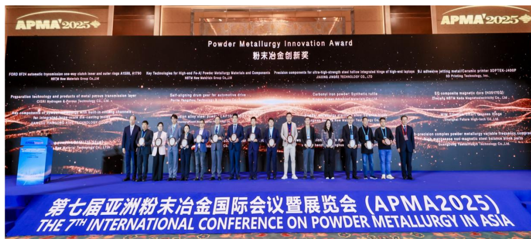
图 1：宁夏悦安荣获第七届亚洲粉末冶金国际会议粉末冶金创新奖

全资子公司宁夏悦安新材料科技有限公司（以下简称“宁夏悦安”）自主研发的“羰基法处理砂矿钛铁矿高效协同生产羰基铁粉与人造金红石”技术，斩获第七届亚洲粉末冶金国际会议“APMA2025 粉末冶金创新奖”，核心工艺创新获行业顶尖认可。该技术突破羰基法处理钛铁矿工业化量产瓶颈，有效降低羰基铁粉生产成本，实现钛铁矿资源高效综合利用。