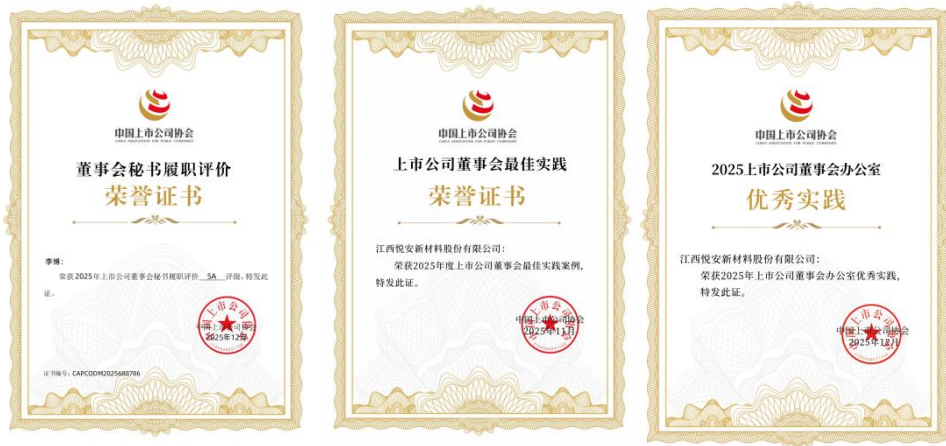
图 4: 中上协董事会、董秘、董办三大评优项目均获殊荣

公司董事会凭借规范高效的运作成效,荣获中国上市公司协会颁发的“2025 年上市公司董事会最佳实践案例”“5A 级董事会秘书”评价和“2025 年度上市公司董办优秀实践案例”三项殊荣,同时公司在上交所信息披露工作考评中获评 B 级,多维度彰显了监管机构与行业协会对公司治理规范度、信息披露质量的高度肯定。