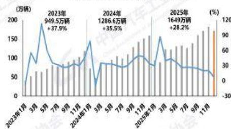
新能源（乘用车&商用车）-销量及增长率