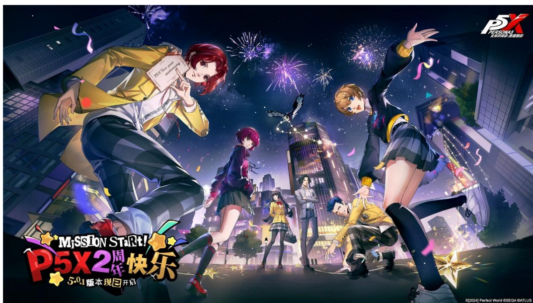
《女神异闻录：夜幕魅影》

异世界都市冒险 JRPG 游戏《女神异闻录：夜幕魅影》于 2025 年 6 月末至 7 月初，相继在日本、欧美、东南亚等海外区域公测，凭借对 P5 主机 IP 的高度还原以及鲜明美术风格、精心剧情叙事、玩法创新突破等获得玩家认可，公测首日即空降日本、欧美等多地 iOS 游戏免费榜榜首，并冲入日本 iOS 畅销榜 TOP3，同时登顶 Steam 全球下载榜首位。该游戏于 2025 年 11 月获得 TGA 2025 年度最佳移动游戏的奖项提名，继《幻塔》之后，成为公司潮流品类赛道的又一有力补充。公司据此在全球一体化产品的研发、发行与运营方面积累起更为丰富的经验，并培养出又一支优秀的内容向产品团队。《女神异闻录：夜幕魅影》国服近期上新二周年版本及系列特别活动，助力公司持续夯实潮流品类创新成果。