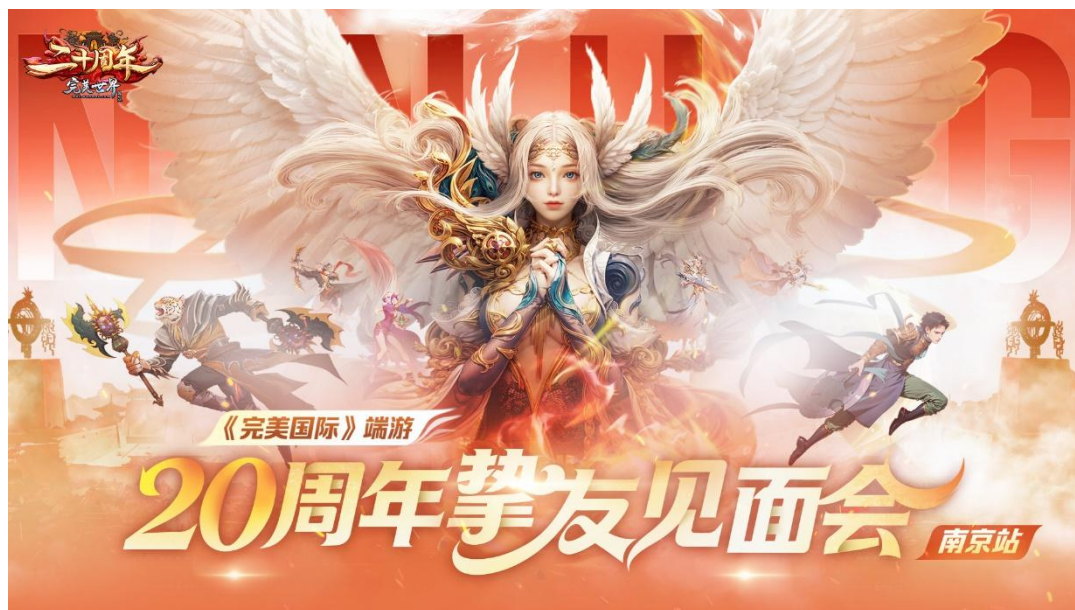
端游《完美世界国际版》

新国风仙侠 MMORPG 端游《诛仙世界》于 2024 年末正式上线，在公司优势的 MMORPG 赛道发力，积极融合玩法微创新与技术新突破，力求为玩家提供更加开放、自由的次世代 MMO 体验，报告期内为公司贡献主要业绩增量。公测至今，项目组持续进行内容更新、优化游戏体验，先后上线两个全新赛季版本，推出新门派、新地图、新剧情、新副本、新玩法、新时装、新活动以及创作激励计划等，并与《剑来》动画深度联动，专属定制地图、剧情、副本等游戏内容，既丰富了原有玩家的游戏体验，又带来《剑来》动画用户的关注和体验。