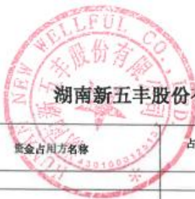
湖南新五丰股份有限公司2025年度非经营性资金占用及其他关联资金往来情况汇总表