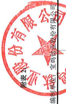
变更募集资金投资项目情况表