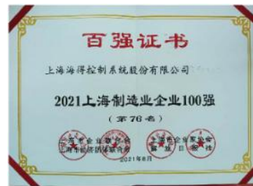
2021上海制造业企业100强