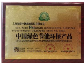
中国绿色节能环保产品