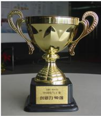
中国电气工业创新力10强