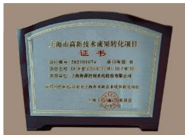
上海市高新技术成果转化项目证书