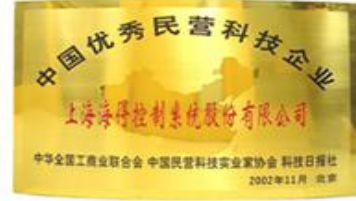
中国优秀民营企业