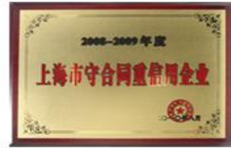
上海市守合同重信用企业