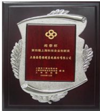
第四界上海科技企业创新奖