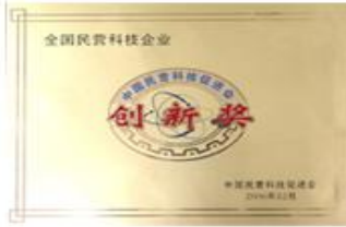
全国民营科技企业创新奖