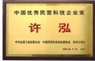
中国优秀民营企业家