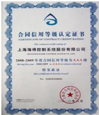
上海市3A级信用企业