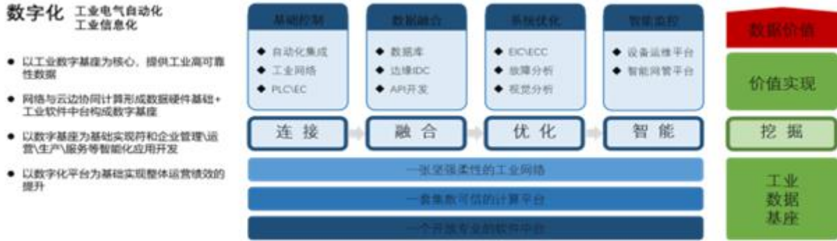
工业信息化业务发展战略