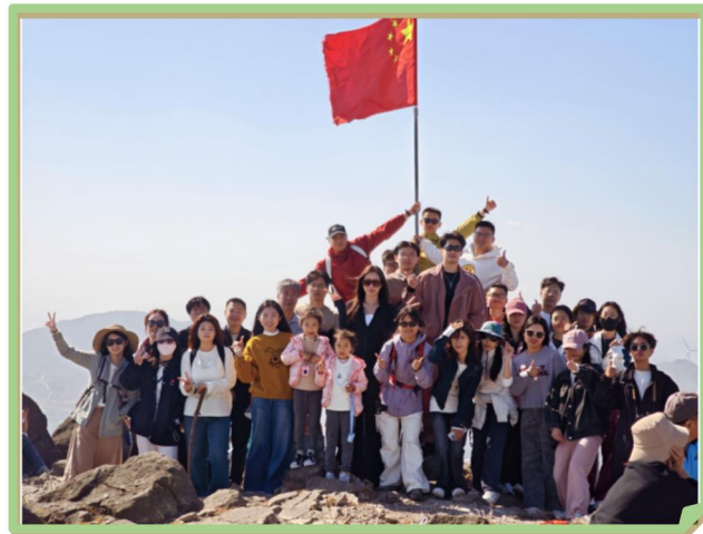
2025年公司举办社团爬山活动