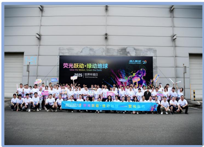
2025年公司开展的荧光夜跑活动

4、日常工作之余，公司积极开展丰富多彩的文化体育活动，营造积极、健康、活跃的企业氛围，充实员工的业余生活，增强团队凝聚力。配备了篮球场、台球室、健身房等活动场地。定期组织各种党员活动、好书分享活动、团建活动、座谈会等，多维度丰富员工的工作生活。