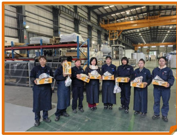
2025 年公司为女性员工发放妇女节礼品

4、日常工作之余，公司积极开展丰富多彩的文化体育活动，营造积极、健康、活跃的企业氛围，充实员工的业余生活，增强团队凝聚力。配备了篮球场、台球室、健身房等活动场地。定期组织各种党员活动、好书分享活动、团建活动、座谈会等，多维度丰富员工的工作生活。