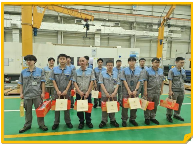
2025 年公司为员工发放中秋礼品

3、2025 年度，公司组织“节日送温暖”活动，春节、中秋佳节、圣诞节等节日都为公司员工送去精美礼品，给员工提供一个温暖的工作环境；不仅如此，公司还组织开展丰富多彩的妇女节系列活动，给女职工们送上一份特别的节日祝福。