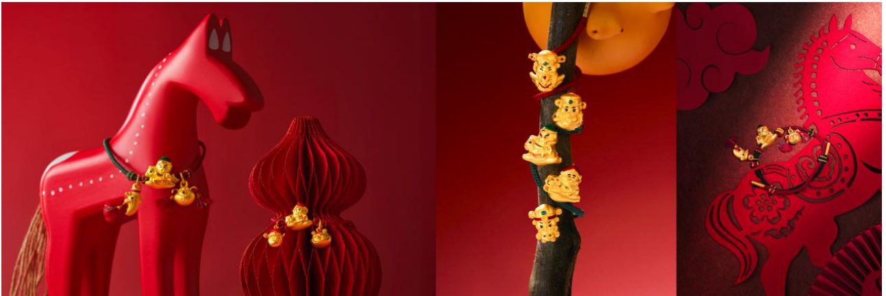
[北高峰财神联名系列]