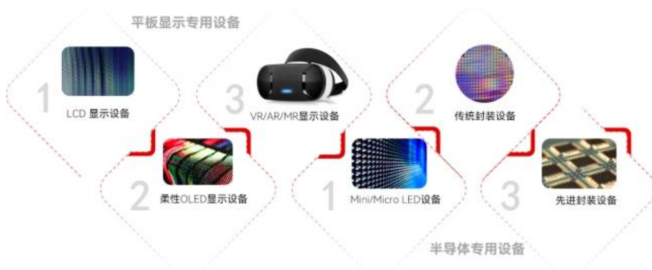
公司主要设备类别及应用

公司是一家专业从事平板显示专用设备及半导体专用设备自主研发、生产与销售的高新技术企业，秉持“成为全球最好的专用设备提供商”的发展愿景，拥有完整的研发、制造、销售和服务体系，致力于为客户提供专业化、高性能的电子专用设备和解决方案。公司产品类别涵盖 LCD 显示设备、柔性 OLED 显示设备、VR/AR/MR 显示设备、Mini/Micro LED 设备、传统封装设备及先进封装设备。基于在贴附、清洗、绑定、脱泡、检测等工艺环节多年的技术沉淀与积累，公司持续深化智能制造装备领域战略布局，构建了平板显示和半导体两大行业业务主线。通过不断推进技术革新、扩展客户资源、优化经营模式、提升市场服务，积极拓展在平板显示专用设备及半导体专用设备领域的市场份额。