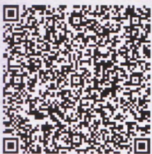
唐松柏的年检二部码