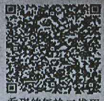
乔琪的年检二维码

发证日期: 1999 12 28 日 Date of Issuance: 1999 12 28 /m /d